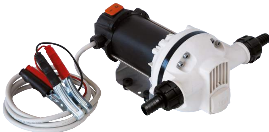
SUZZARABLUE PUMP DC