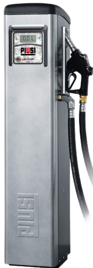
SELF SERVICE B.SMART

Aggiorna il suo sistema MC a B.Smart con il KIT HARDWARE 1.0/2018 UPGRADE