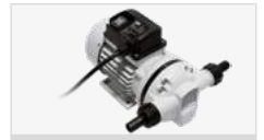
SUZZARBLUE PUMP AC