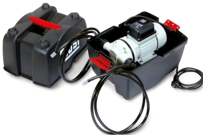
PIUSIBOX CAR SUCTION