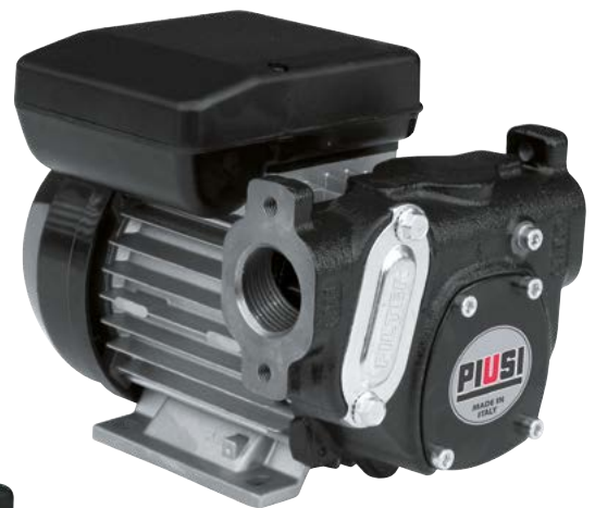
PANTHER 56 (flange non include)