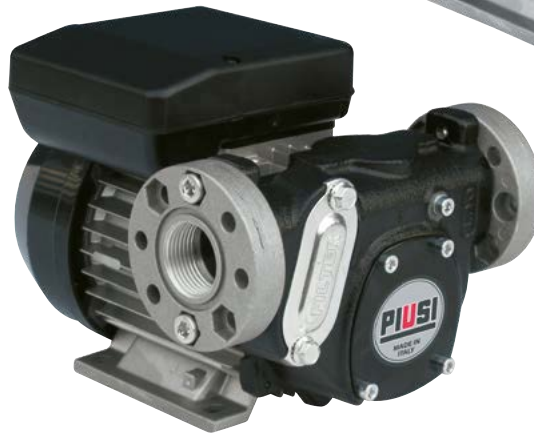
PANTHER 72 - PANTHER 90 (flange include)