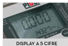
DISPLAY A 5 CIFRE