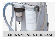
FILTRAZIONE A DUE FASI